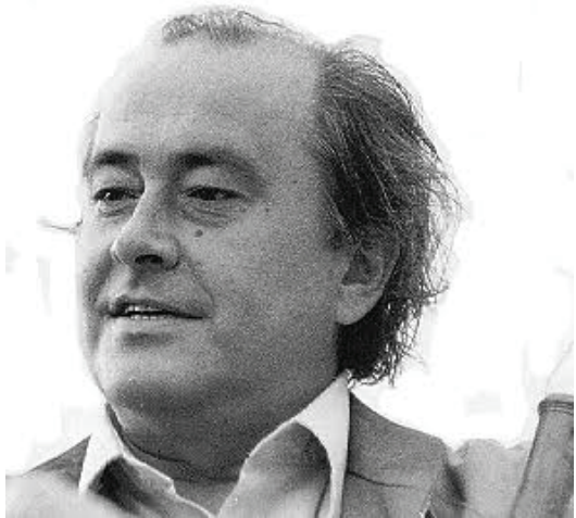
CZIDRA LÁSZLÓ (1940–2001)